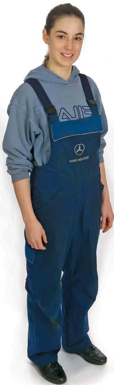
Avant: Une tenue pour l'atelier, qui ne convient plus aux nouvelles fonctions de notre modèle.